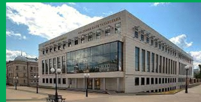
Международная научная мультikonференция: